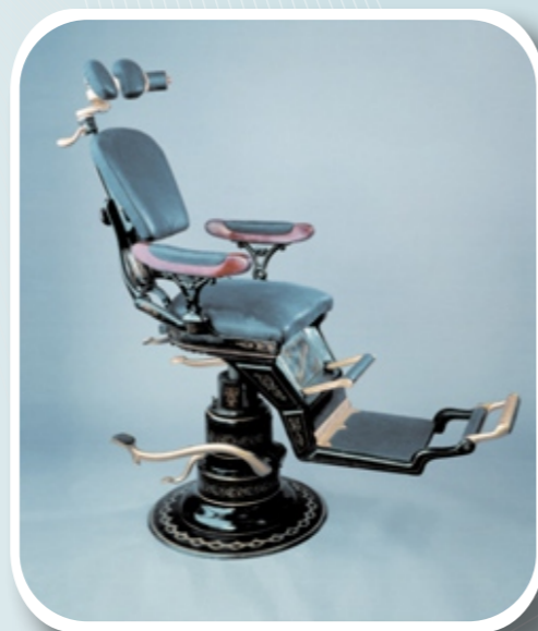
The Ritter treatment chair of 1887