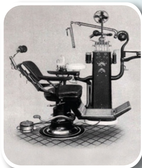
The 1917 Ritter system - genesis of modern dental equipment

Online surveys still list "Made in Germany" as a trusted source for quality, performance and reliability for goods available around the world, especially for electronic and technological products. (source: www.dw-world.com ).